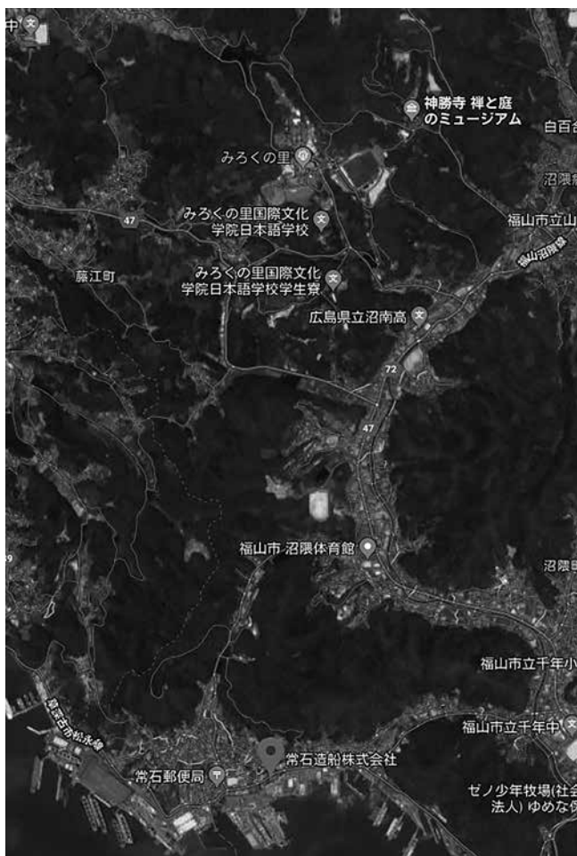
図4：神勝寺と常石造船の位置関係