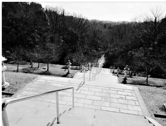
図3：神勝寺無明院前の階段